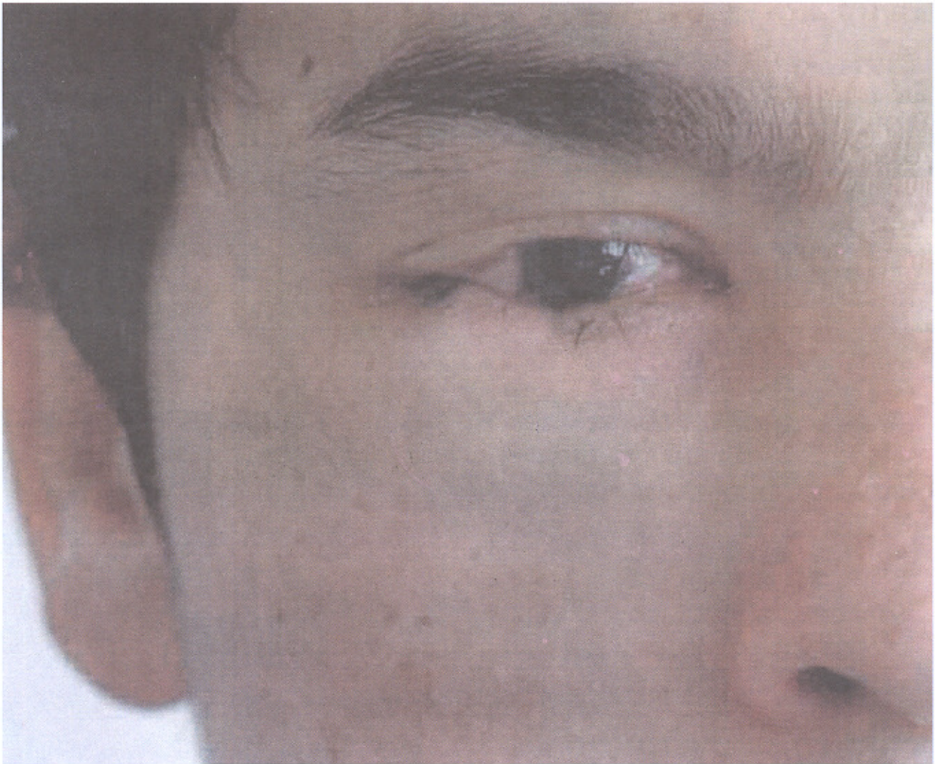
تصویر شماره ۳- نمای بالینی بیمار بعد از درمان