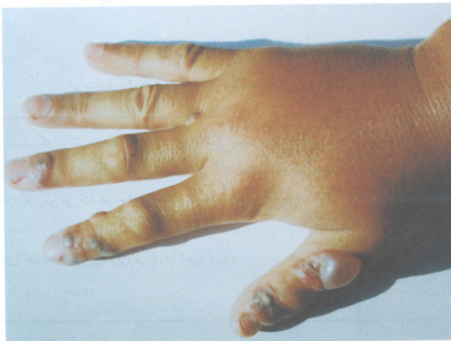
تصویر شماره ۱- ضایعه‌های متعدد اورف روی دست راست بیمار همراه با یک ضایعه تاوولی روی انگشت شست بیمار