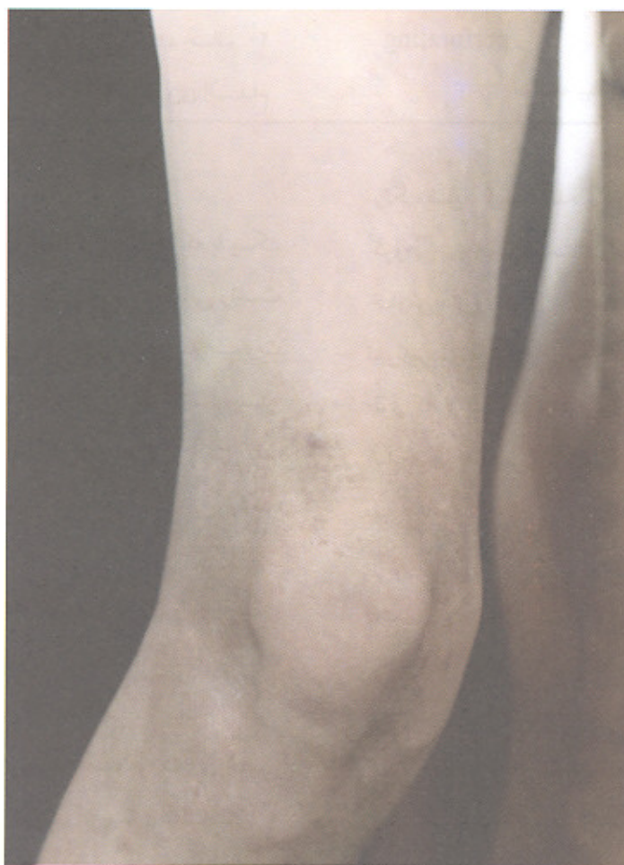
تصویر شماره ۱- پاپولهای متعدد در دیستال ران همراه با پوسته ریزی

به ندرت به همراه مورفه آ آی خطی، کلسینوزیز ایجاد