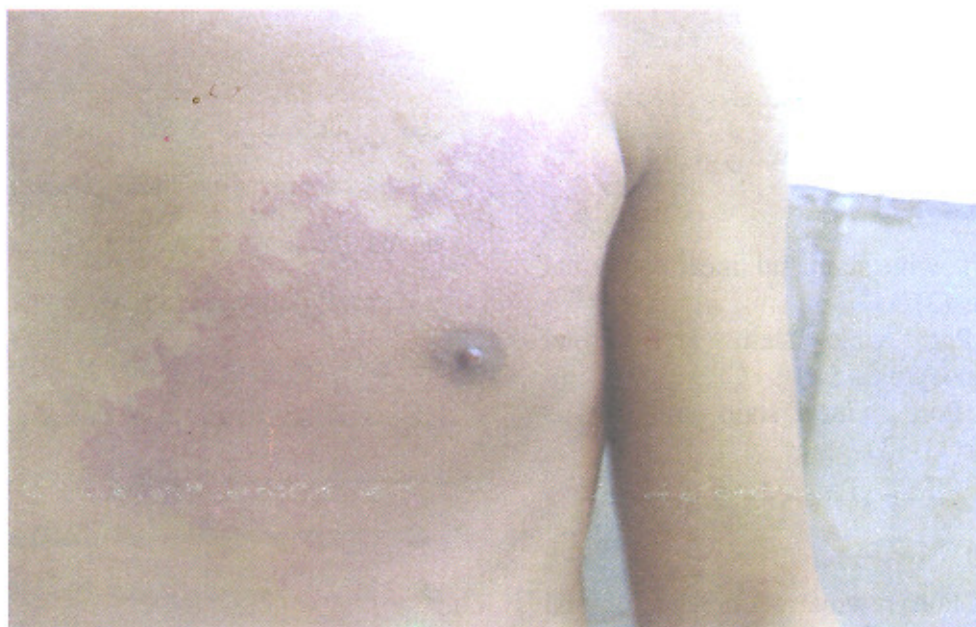
تصویر شماره ۲